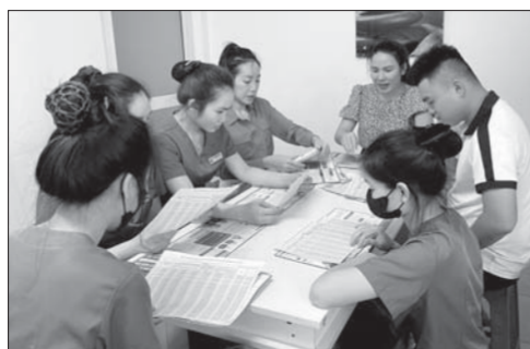
Cán bộ Bảo hiểm xã hội tỉnh tuyên truyền chính sách bảo hiểm xã hội tự nguyện tại một spa trên địa bàn TP.Quảng Ngãi.

Chị Đào cho biết, trước khi đến các spa, điểm trường mầm non tự thực nhỏ lẻ để tư vấn thì chúng tôi sẽ đăng ký làm