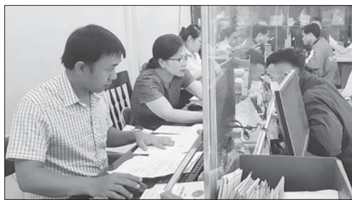
Nhân viên Trung tâm Dịch vụ việc làm tỉnh (Sở LĐ-TB&XH) giải quyết hồ sơ cho người dân.

Thực hiện Nghị quyết 19, Sở Y tế đã triển khai thực hiện đồng bộ, tinh gọn bộ máy, giảm mạnh đầu mối. Theo đó, Sở đã giảm 38 tổ chức, đơn vị; giảm 1.155 người so với tổng biên chế được giao năm 2015, tương đương với giảm 26,27%. Bên cạnh đó, có 2.362 người làm việc được phê duyệt theo Đề án vị trí việc làm tại 4 đơn vị sự nghiệp đã thay thế người trả chi thường xuyên từ ngân sách nhà nước bằng trả lương từ 100% nguồn thu sự nghiệp. Đến nay, hầu hết các đơn vị sự