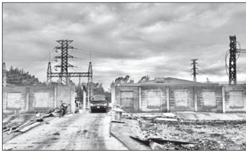
Trạm biến áp 110kV thuộc dự án Trạm biến áp 110kV Mỹ Khê chưa hoàn thành do vướng mặt bằng.

Theo tiến độ được phê duyệt lần đầu thì dự án Trạm biến áp (TBA) 110kV Mỹ Khê và đầu nối đi qua địa bàn huyện Sơn Tịnh và TP.Quảng Ngãi phải hoàn thành đóng điện trước ngày 31/12/2022. Tuy nhiên, do không có mặt bằng để triển khai thi công, ngành điện đã phải gia hạn dự án 3 lần. Trong đó, lần gia hạn thứ 3 để ra mục tiêu hoàn thành đóng điện dự án trước ngày 30/6/2024. Song, đến nay dự án mới hoàn thành thi công xong phần TBA 110kV, hoàn thành đúc móng, dựng cột 25/30 vị trí, hoàn thành kéo dây 2,64km/8,424km. Còn lại 5/30 cột và 5,784km đường dây chưa thi công,