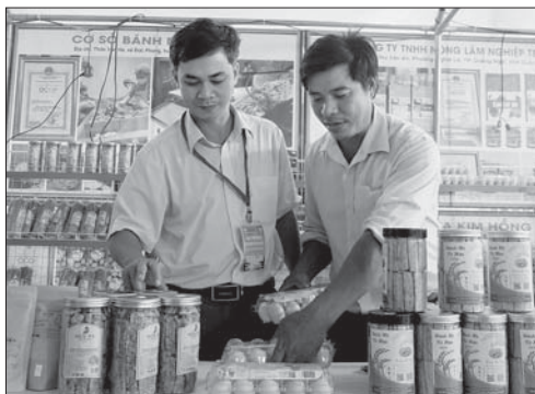
Nhiều sản phẩm OCOP trên địa bàn tỉnh ngày càng mở rộng thị trường tiêu thụ thông qua các chương trình, hội chợ, hội thảo.

Theo đó, năm 2024, toàn tỉnh phấn đấu có thêm 70 sản phẩm đạt OCOP từ 3 - 5 sao; trong đó có 4 - 6 sản phẩm được UBND tỉnh cấp giấy chứng nhận đạt OCOP 4 sao và 1 - 2 sản phẩm có tiềm năng đạt