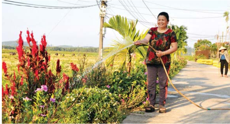
Người dân thị trấn Châu Ổ (Bình Sơn) chăm sóc đường hoa.

Điểm mới trong việc tổ chức học tập nghị quyết ở cấp huyện hiện nay là theo hình thức trực tuyến với quy mô lớn đến tận cấp xã. Nhiều cán bộ, đảng viên phấn khởi khi được nghe trực tiếp các đồng chí lãnh đạo cấp cao, những người đã tham gia vào quá trình soạn thảo nghị quyết, có điều kiện hiểu sâu hơn tinh thần, nội dung của nghị quyết, tạo sự tin tưởng vững chắc vào chủ trương, quyết sách của Đảng, tích cực góp phần vào việc thực hiện thắng lợi nghị quyết.