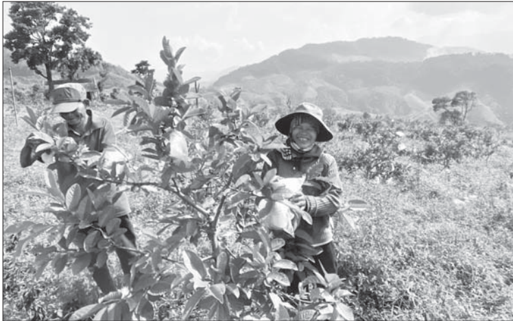
Dựa vào “Bản đồ thổ nhưỡng - nông hóa”, huyện Sơn Tây quy hoạch những vùng cây ăn quả hàng hóa, góp phần nâng cao hiệu quả kinh tế cho người dân trên địa bàn.

Trước đây, chỉ có kỹ sư, chuyên gia về nông nghiệp mới biết được địa chất, thổ nhưỡng