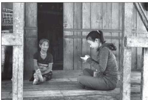
Nhân viên Chi cục Thống kê huyện Sơn Tây thu thập thông tin điều tra dân số và nhà ở giữa kỳ năm 2024 tại địa bàn khu dân cư Nước Vương, thôn Tả Đô, xã Sơn Tân (Sơn Tây).

Thực hiện Đề án "Ứng dụng công nghệ thông tin - truyền thông trong hệ thống thống kê nhà nước giai đoạn 2017 - 2025, tầm nhìn đến năm 2030", ngành thống kê tỉnh không ngừng đổi mới, ứng dụng công nghệ thông tin trong công tác thống kê. Ngành đã chuyển đổi từ hình thức thu thập thông tin bằng phiếu giấy qua hình thức thu thập bằng thiết bị điện tử. Thay đổi hình thức quản lý dữ liệu phân tán sang hình thức quản lý dữ liệu tập trung và đẩy mạnh tương tác giữa người cung cấp thông tin với điều tra viên thống kê (người làm công tác thống kê trong quá trình sản xuất thống tin thống kê). Đến nay, cơ bản các cuộc điều tra thống kê đã được chuyển đổi sang hình thức kê