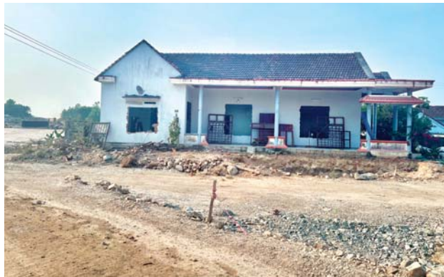
Nhà ở của người dân phường Phổ Hòa (TX.Đức Phổ) sau khi thu hồi đất xây dựng cao tốc Bắc - Nam còn lại một phần diện tích nằm trong hành lang đường bộ của công trình cao tốc.

Công tác giải phóng mặt bằng (GPMB) phục vụ dự án Xây dựng công trình đường bộ cao tốc Bắc - Nam phía đông, giai đoạn 2021 - 2025 đi qua địa bàn Quảng Ngãi (cao tốc Bắc - Nam) đã cơ bản hoàn thành. Hiện có một số vị trí sau khi thu hồi, phần diện tích còn lại nằm trong hành lang tuyến cao tốc không thể xây dựng nhà ở cần phải xem xét thu hồi.