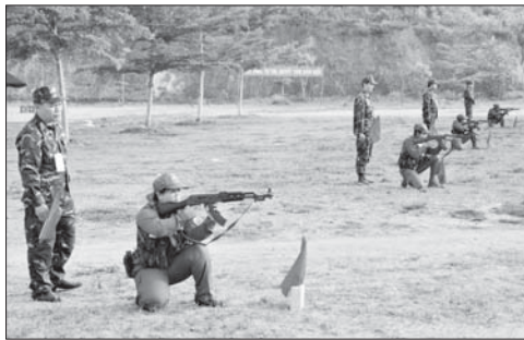
Các vận động viên thực hành bắn súng tại hội thao.