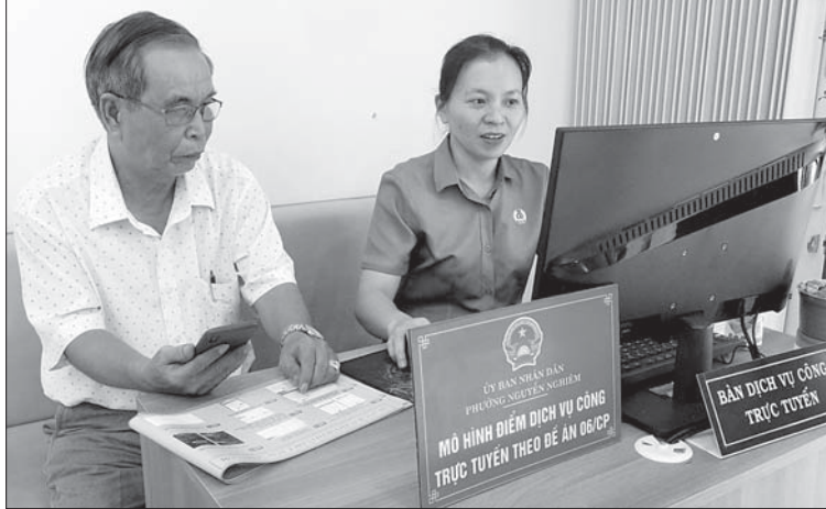
Cán bộ phường Nguyễn Nghiêm (TX.Đức Phổ) hướng dẫn người dân thực hiện dịch vụ công trực tuyến.