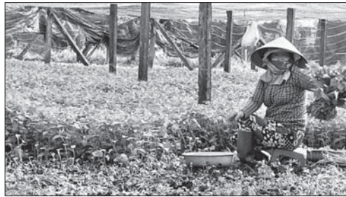
Nông dân xã Tịnh Châu (TP.Quảng Ngãi) thu hoạch rau diếp cá.

Tại xã Tịnh An, nhiều hộ dân cũng tận dụng vốn vay từ Ngân hàng CSXH đầu tư nuôi bò vỗ béo, trồng bắp và rau màu mang lại thu nhập cao. Ông Đào Hữu Nghĩa (60 tuổi), ở thôn Ngọc Thạch, xã Tịnh An cho biết,