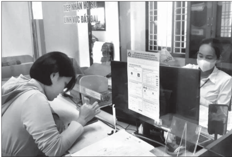
Cán bộ Văn phòng Đăng ký đất đai tỉnh - Chi nhánh huyện Tư Nghĩa giải quyết hồ sơ, thủ tục hành chính cho người dân.

Thực hiện chỉ đạo của Sở TN&MT, Văn phòng Đăng ký đất đai tỉnh - Chi nhánh các huyện, thị xã, thành phố đã chuyển đổi quy trình, thực hiện TTHC, dịch vụ công từ phương thức truyền thống sang môi trường điện tử. Tiến hành chuẩn hóa, tái cấu trúc quy trình nghiệp vụ, xây dựng các biểu mẫu điện tử, phần mềm chuyên dụng để số hóa hồ sơ, kết quả giải quyết TTHC để làm giàu kho dữ liệu, tạo thuận