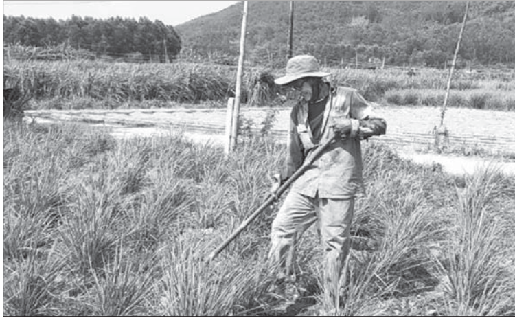
Nông dân xã Tịnh An (TP.Quảng Ngãi) trồng cỏ chăn nuôi bò để phát triển kinh tế.

Tịnh Châu Huỳnh Văn Hiếu cho biết, những năm gần đây, mô hình trồng rau diếp cá sử dụng trụ bê tông cốt thép và phủ bạt che nắng cho rau cho năng suất cao, được nông dân áp dụng rộng rãi. Tuy nhiên, mô hình này đòi hỏi vốn lớn, chi phí bình quân 10 triệu đồng/sào. Nhờ nguồn vốn vay từ Ngân hàng CSXH mà nhiều nông dân đã mạnh dạn đầu tư trồng rau. Toàn xã hiện có hơn 40ha rau diếp cá, đem lại nguồn thu đáng kể cho nông dân địa phương.