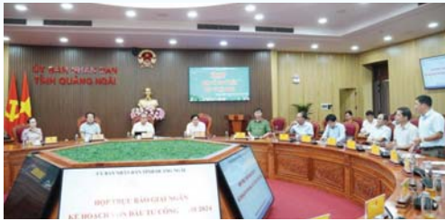
Quang cảnh cuộc họp.