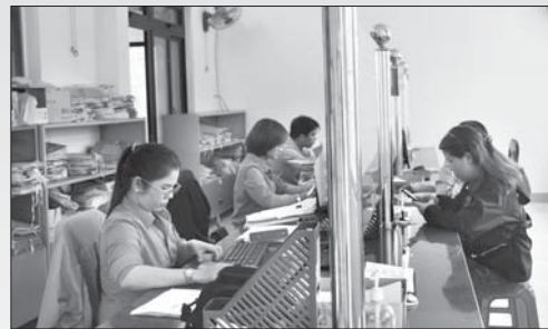
Cán bộ, công chức thực hiện tiếp nhận, xử lý, giải quyết và trả kết quả hồ sơ TTHC chịu trách nhiệm thực hiện số hóa. Trong ảnh: Bộ phận một cửa phường Phố Minh (TX.Đức Phổ). ANH Ỡ THU

Theo quy định tại Thông tư số 01/2023/TT-VPCP ngày 5/4/2023 của Văn phòng Chính phủ, có 3 loại giấy tờ, tài liệu mà các cơ quan, đơn vị, địa phương phải thực hiện số hóa trong TTHC. Đó là các giấy tờ liên quan đến thành phần hồ sơ mà tổ chức, cá nhân nộp để thực hiện TTHC; kết quả thẩm tra, xác minh, trả lời ý kiến của các cơ quan, đơn vị tham gia trong quá trình giải quyết TTHC (trừ trường hợp pháp luật chuyên ngành có quy định khác) và kết quả giải quyết của TTHC còn hiệu lực theo quy định tại Điều 25, Nghị định số 45/2020/NĐ-CP ngày 8/4/2020 của Chính